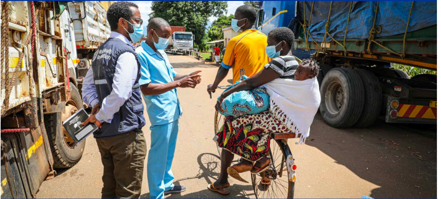
Campagne de vaccination contre la poliomyélite au Malawi.