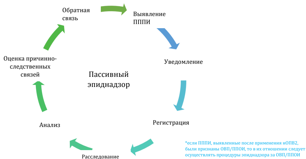
Рисунок 2. Пассивный эпиднадзор за ПППИ* после применения нОПВ2 или других вакцин

*В любом месте страны, если случай был зарегистрирован реципиентом/представителем после применения нОПВ2 или другой вакцины.