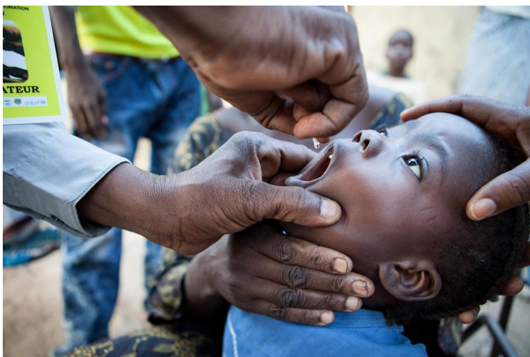
116 million d'enfants ont été vaccinés dans 13 pays en seulement quatre jours.

Une des plus grandes campagnes synchronisées de vaccination jamais organisée en Afrique a été menée du 25 au 28 mars pour vacciner 116 millions d'enfants contre la poliomyélite. Près de 200 000 agents de santé ont travaillé sans relâche pendant ces quatre journées pour vacciner des enfants dans 13 pays d'Afrique centrale et d'Afrique de l'Ouest. Cette campagne s'inscrit dans le cadre d'une action d'urgence pour endiguer la poliomyélite sur le continent suite à la flambée qu'a connu le Nigéria en 2016. [En savoir plus]