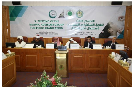
D'éminents spécialistes du monde musulman ont rencontré des représentants de l'Organisation mondiale de la Santé

Le 4 août, le Groupe consultatif islamique s'est réuni à la Banque islamique de développement à Djedda (Arabie Saoudite) : il s'agissait de sa troisième réunion annuelle destinée à fournir des orientations de haut niveau sur les efforts d'éradication dans le monde musulman. La Banque islamique de développement a apporté son soutien dans le passé moyennant des subventions techniques aux partenaires africains de la lutte contre la poliomyélite et un montant de US $100 millions pour mettre fin à la maladie. La discussion a essentiellement porté sur la nécessité d'instaurer un climat de confiance et d'encourager les communautés